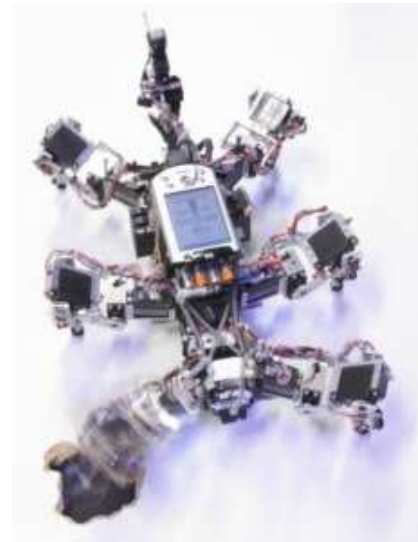
Roboter mit flexiblem Gang