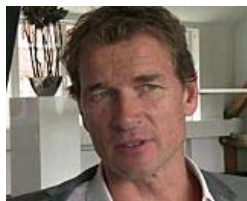
"Lehmann über Machtwechsel im internati...