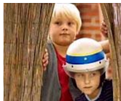
2. Platz: Rico, Oskar und die Tieferschatten